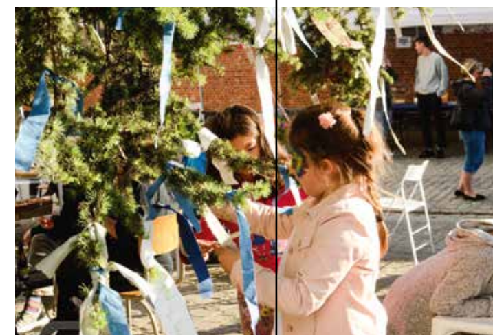
FÊTE DE LA PLACE

CONTACT : CHRISTINE@MAISONDELACREATION.ORG MAT.HEEMBEEK@BRUNETTE.BRUCITY.BE