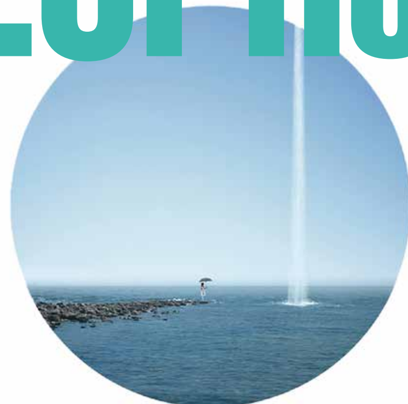
TIME © LIU XIUFANG