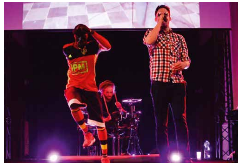
ARO © MARION COLARD

La résidence aboutira à un concert au Centre culturel coréen de Bruxelles (création mondiale! date à déterminer)