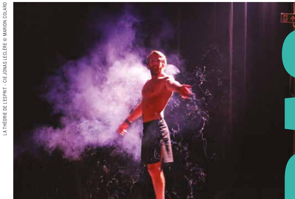
LA THÉORIE DE L'ESPRIT - CIE JONAS LECLÈRE © MARION COLARD