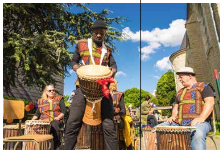
FÊTE DE LA PLACE

WWW.FACEBOOK.COM/TROUPE.KAYIROO CATY : 0497 18 22 12 KAYIROO@HOTMAIL.COM